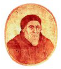
Páll í Selárdal.