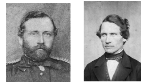
Mektarmenni úr ættinni. Bergur Thorberg landshöfðingi og amtmaður sunnan og vestan var bróðir Kristínar; Helgi Hálfánarson sálmaskáld, alþingismaður og forstöðumaður prestaskólans var bróðir Einars.